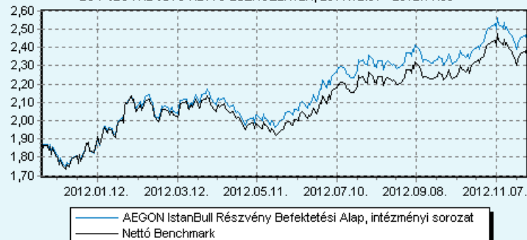
EGY JEGYRE JUTÓ NETTÓ ESZKÖZÉRTÉK, 2011.12.01 - 2012.11.30

Az alapok múltbeli teljesítménye nem nyújt garanciát a jövőbeli hozamok nagyságára. Jelen hirdetés nem minősül ajánlattételnek vagy befektetési tanácsadásnak. A befektetés részletes feltételeit az Alap Tájékoztatója tartalmazza, mely a mindenkor érvényes kondíciós listákkal együtt megtalálható a forgalmazási helyeken. A befektetési alap forgalmazásával (vétel, tartás, eladás) kapcsolatos költségek az alap kezelési szabályzatában és a forgalmazási helyeken megismerhetők.