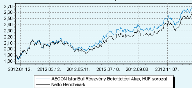
EGY JEGYRE JUTÓ NETTÓ ESZKÖZÉRTÉK, 2012.01.01 - 2012.12.31

Az alapok múltbeli teljesítménye nem nyújt garanciát a jövőbeli hozamok nagyságára. Jelen hirdetés nem minősül ajánlattételnek vagy befektetési tanácsadásnak. A befektetés részletes feltételeit az Alap Tájékoztatója tartalmazza, mely a mindenkor érvényes kondíciós listákkal együtt megtalálható a forgalmazási helyeken. A befektetési alap forgalmazásával (vétel, tartás, eladás) kapcsolatos költségek az alap kezelési szabályzatában és a forgalmazási helyeken megismerhetők.