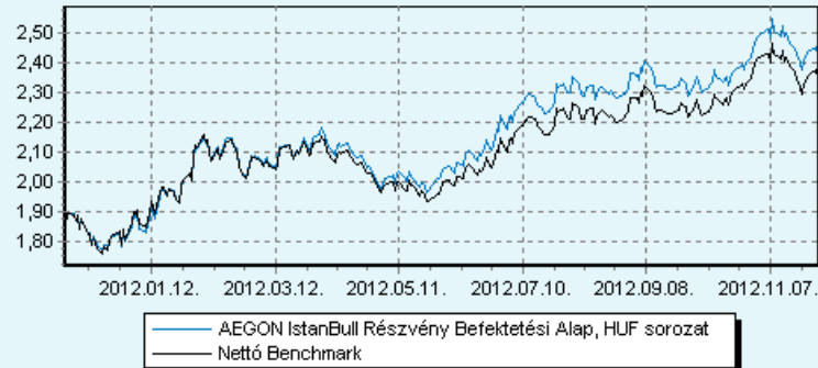
EGY JEGYRE JUTÓ NETTÓ ESZKÖZÉRTÉK, 2011.12.01 - 2012.11.30

Az alapok múltbeli teljesítménye nem nyújt garanciát a jövőbeli hozamok nagyságára. Jelen hirdetés nem minősül ajánlattételnek vagy befektetési tanácsadásnak. A befektetés részletes feltételeit az Alap Tájékoztatója tartalmazza, mely a mindenkor érvényes kondíciós listákkal együtt megtalálható a forgalmazási helyeken. A befektetési alap forgalmazásával (vétel, tartás, eladás) kapcsolatos költségek az alap kezelési szabályzatában és a forgalmazási helyeken megismerhetők.