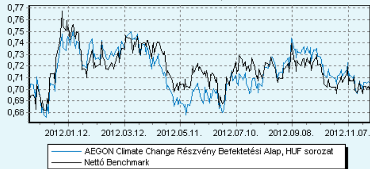
EGY JEGYRE JUTÓ NETTÓ ESZKÖZÉRTÉK, 2011.12.01 - 2012.11.30

Az alapok múltbeli teljesítménye nem nyújt garanciát a jövőbeli hozamok nagyságára. Jelen hirdetés nem minősül ajánlattételnek vagy befektetési tanácsadásnak. A befektetés részletes feltételeit az Alap Tájékoztatója tartalmazza, mely a mindenkor érvényes kondíciós listákkal együtt megtalálható a forgalmazási helyeken. A befektetési alap forgalmazásával (vétel, tartás, eladás) kapcsolatos költségek az alap kezelési szabályzatában és a forgalmazási helyeken megismerhetők.