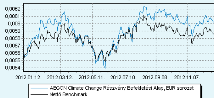
EGY JEGYRE JUTÓ NETTÓ ESZKÖZÉRTÉK, 2012.01.01 - 2012.12.31

Az alapok múltbeli teljesítménye nem nyújt garanciát a jövőbeli hozamok nagyságára. Jelen hirdetés nem minősül ajánlattételnek vagy befektetési tanácsadásnak. A befektetés részletes feltételeit az Alap Tájékoztatója tartalmazza, mely a mindenkor érvényes kondíciós listákkal együtt megtalálható a forgalmazási helyeken. A befektetési alap forgalmazásával (vétel, tartás, eladás) kapcsolatos költségek az alap kezelési szabályzatában és a forgalmazási helyeken megismerhetők.