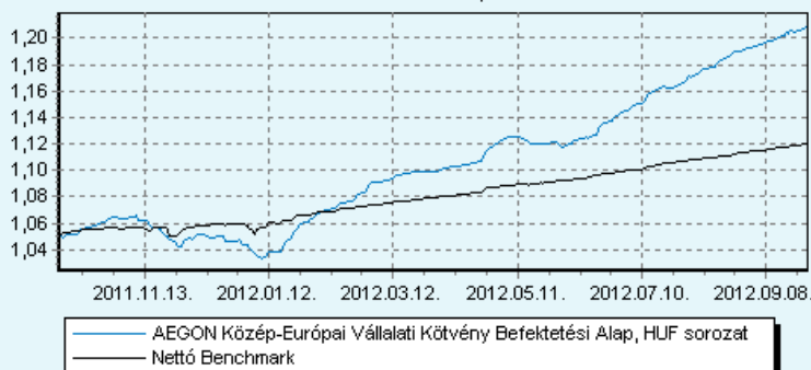
EGY JEGYRE JUTÓ NETTÓ ESZKÖZÉRTÉK, 2011.10.01 - 2012.09.30

Az alapok múltbeli teljesítménye nem nyújt garanciát a jövőbeli hozamok nagyságára. Jelen hirdetés nem minősül ajánlattételnek vagy befektetési tanácsadásnak. A befektetés részletes feltételeit az Alap Tájékoztatója tartalmazza, mely a mindenkor érvényes kondíciós listákkal együtt megtalálható a forgalmazási helyeken. A befektetési alap forgalmazásával (vétel, tartás, eladás) kapcsolatos költségek az alap kezelési szabályzatában és a forgalmazási helyeken megismerhetők.