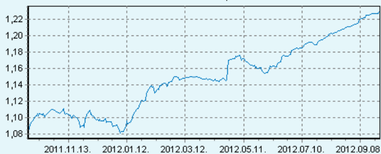
EGY JEGYRE JUTÓ NETTÓ ESZKÖZÉRTÉK, 2011.10.01 - 2012.09.30

Az alapok múltbeli teljesítménye nem nyújt garanciát a jövőbeli hozamok nagyságára. Jelen hirdetés nem minősül ajánlattételnek vagy befektetési tanácsadásnak. A befektetés részletes feltételeit az Alap Tájékoztatója tartalmazza, mely a mindenkor érvényes kondíciós listákkal együtt megtalálható a forgalmazási helyeken. A befektetési alap forgalmazásával (vétel, tartás, eladás) kapcsolatos költségek az alap kezelési szabályzatában és a forgalmazási helyeken megismerhetők.