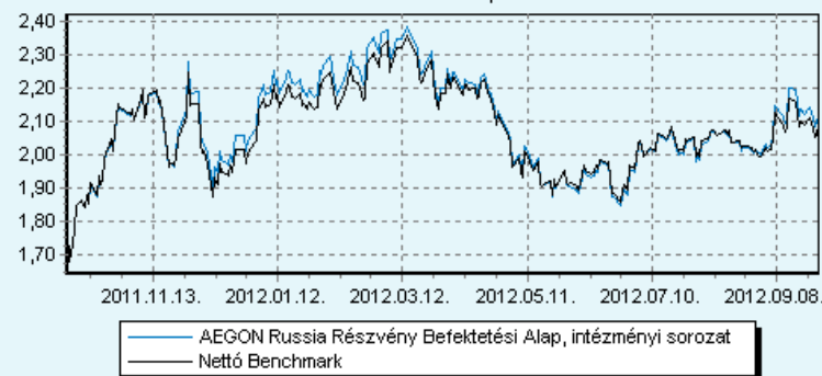
EGY JEGYRE JUTÓ NETTÓ ESZKÖZÉRTÉK, 2011.10.01 - 2012.09.30

Az alapok múltbeli teljesítménye nem nyújt garanciát a jövőbeli hozamok nagyságára. Jelen hirdetés nem minősül ajánlattételnek vagy befektetési tanácsadásnak. A befektetés részletes feltételeit az Alap Tájékoztatója tartalmazza, mely a mindenkor érvényes kondíciós listákkal együtt megtalálható a forgalmazási helyeken. A befektetési alap forgalmazásával (vétel, tartás, eladás) kapcsolatos költségek az alap kezelési szabályzatában és a forgalmazási helyeken megismerhetők.