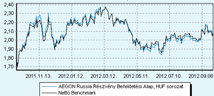
EGY JEGYRE JUTÓ NETTÓ ESZKÖZÉRTÉK, 2011.10.01 - 2012.09.30

Az alapok múltbeli teljesítménye nem nyújt garanciát a jövőbeli hozamok nagyságára. Jelen hirdetés nem minősül ajánlattételnek vagy befektetési tanácsadásnak. A befektetés részletes feltételeit az Alap Tájékoztatója tartalmazza, mely a mindenkor érvényes kondíciós listákkal együtt megtalálható a forgalmazási helyeken. A befektetési alap forgalmazásával (vétel, tartás, eladás) kapcsolatos költségek az alap kezelési szabályzatában és a forgalmazási helyeken megismerhetők.