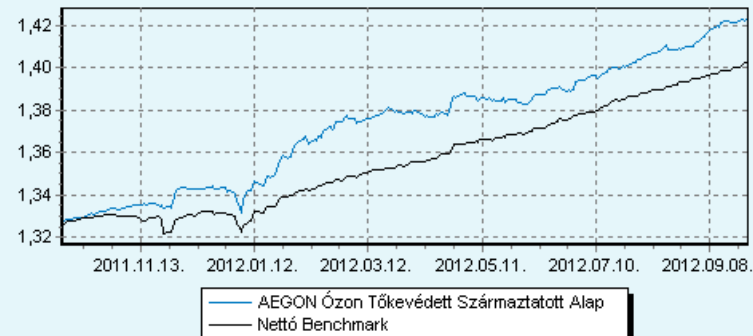
EGY JEGYRE JUTÓ NETTÓ ESZKÖZÉRTÉK, 2011.10.01 - 2012.09.30

Az alapok múltbeli teljesítménye nem nyújt garanciát a jövőbeli hozamok nagyságára. Jelen hirdetés nem minősül ajánlattételnek vagy befektetési tanácsadásnak. A befektetés részletes feltételeit az Alap Tájékoztatója tartalmazza, mely a mindenkor érvényes kondíciós listákkal együtt megtalálható a forgalmazási helyeken. A befektetési alap forgalmazásával (vétel, tartás, eladás) kapcsolatos költségek az alap kezelési szabályzatában és a forgalmazási helyeken megismerhetők.