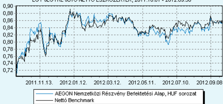
EGY JEGYRE JUTÓ NETTÓ ESZKÖZÉRTÉK, 2011.10.01 - 2012.09.30

Az alapok múltbeli teljesítménye nem nyújt garanciát a jövőbeli hozamok nagyságára. Jelen hirdetés nem minősül ajánlattételnek vagy befektetési tanácsadásnak. A befektetés részletes feltételeit az Alap Tájékoztatója tartalmazza, mely a mindenkor érvényes kondíciós listákkal együtt megtalálható a forgalmazási helyeken. A befektetési alap forgalmazásával (vétel, tartás, eladás) kapcsolatos költségek az alap kezelési szabályzatában és a forgalmazási helyeken megismerhetők.