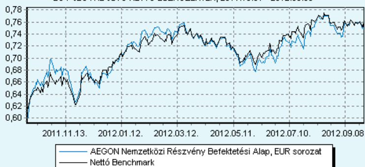
EGY JEGYRE JUTÓ NETTÓ ESZKÖZÉRTÉK, 2011.10.01 - 2012.09.30

Az alapok múltbeli teljesítménye nem nyújt garanciát a jövőbeli hozamok nagyságára. Jelen hirdetés nem minősül ajánlattételnek vagy befektetési tanácsadásnak. A befektetés részletes feltételeit az Alap Tájékoztatója tartalmazza, mely a mindenkor érvényes kondíciós listákkal együtt megtalálható a forgalmazási helyeken. A befektetési alap forgalmazásával (vétel, tartás, eladás) kapcsolatos költségek az alap kezelési szabályzatában és a forgalmazási helyeken megismerhetők.