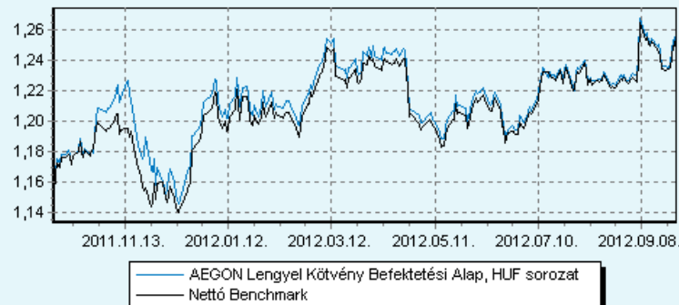
EGY JEGYRE JUTÓ NETTÓ ESZKÖZÉRTÉK, 2011.10.01 - 2012.09.30

Az alapok múltbeli teljesítménye nem nyújt garanciát a jövőbeli hozamok nagyságára. Jelen hirdetés nem minősül ajánlattételnek vagy befektetési tanácsadásnak. A befektetés részletes feltételeit az Alap Tájékoztatója tartalmazza, mely a mindenkor érvényes kondíciós listákkal együtt megtalálható a forgalmazási helyeken. A befektetési alap forgalmazásával (vétel, tartás, eladás) kapcsolatos költségek az alap kezelési szabályzatában és a forgalmazási helyeken megismerhetők.