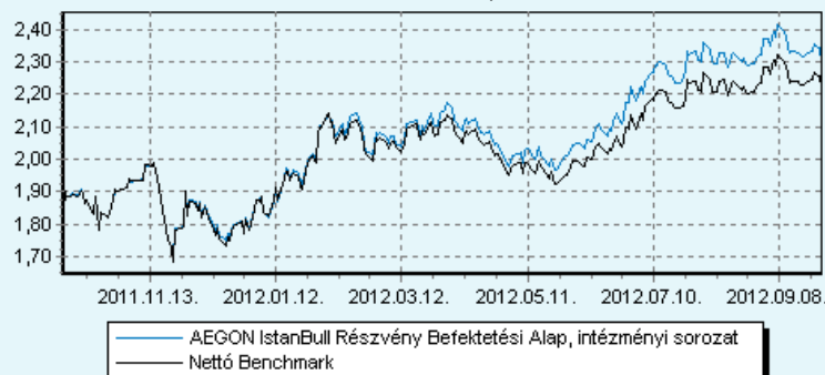
EGY JEGYRE JUTÓ NETTÓ ESZKÖZÉRTÉK, 2011.10.01 - 2012.09.30

Az alapok múltbeli teljesítménye nem nyújt garanciát a jövőbeli hozamok nagyságára. Jelen hirdetés nem minősül ajánlattételnek vagy befektetési tanácsadásnak. A befektetés részletes feltételeit az Alap Tájékoztatója tartalmazza, mely a mindenkor érvényes kondíciós listákkal együtt megtalálható a forgalmazási helyeken. A befektetési alap forgalmazásával (vétel, tartás, eladás) kapcsolatos költségek az alap kezelési szabályzatában és a forgalmazási helyeken megismerhetők.