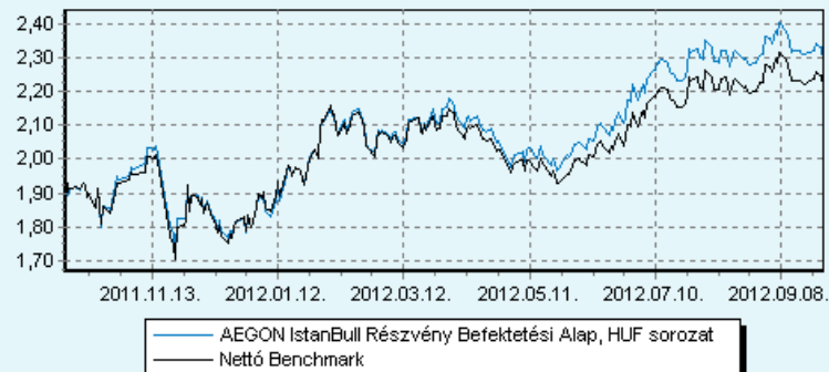
EGY JEGYRE JUTÓ NETTÓ ESZKÖZÉRTÉK, 2011.10.01 - 2012.09.30

Az alapok múltbeli teljesítménye nem nyújt garanciát a jövőbeli hozamok nagyságára. Jelen hirdetés nem minősül ajánlattételnek vagy befektetési tanácsadásnak. A befektetés részletes feltételeit az Alap Tájékoztatója tartalmazza, mely a mindenkor érvényes kondíciós listákkal együtt megtalálható a forgalmazási helyeken. A befektetési alap forgalmazásával (vétel, tartás, eladás) kapcsolatos költségek az alap kezelési szabályzatában és a forgalmazási helyeken megismerhetők.