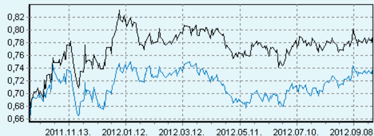
EGY JEGYRE JUTÓ NETTÓ ESZKÖZÉRTÉK, 2011.10.01 - 2012.09.30

Az alapok múltbeli teljesítménye nem nyújt garanciát a jövőbeli hozamok nagyságára. Jelen hirdetés nem minősül ajánlattételnek vagy befektetési tanácsadásnak. A befektetés részletes feltételeit az Alap Tájékoztatója tartalmazza, mely a mindenkor érvényes kondíciós listákkal együtt megtalálható a forgalmazási helyeken. A befektetési alap forgalmazásával (vétel, tartás, eladás) kapcsolatos költségek az alap kezelési szabályzatában és a forgalmazási helyeken megismerhetők.