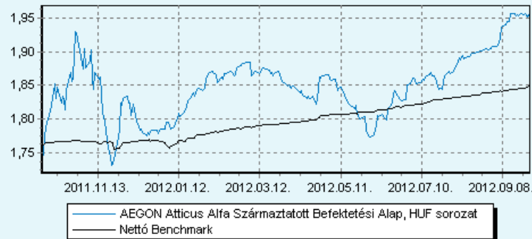
EGY JEGYRE JUTÓ NETTÓ ESZKÖZÉRTÉK, 2011.10.01 - 2012.09.30

Az alapok múltbeli teljesítménye nem nyújt garanciát a jövőbeli hozamok nagyságára. Jelen hirdetés nem minősül ajánlattételnek vagy befektetési tanácsadásnak. A befektetés részletes feltételeit az Alap Tájékoztatója tartalmazza, mely a mindenkor érvényes kondíciós listákkal együtt megtalálható a forgalmazási helyeken. A befektetési alap forgalmazásával (vétel, tartás, eladás) kapcsolatos költségek az alap kezelési szabályzatában és a forgalmazási helyeken megismerhetők.