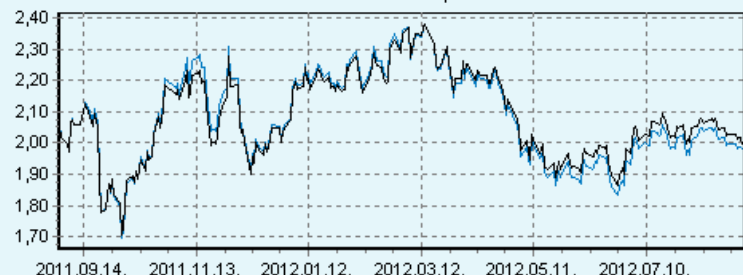
EGY JEGYRE JUTÓ NETTÓ ESZKÖZÉRTÉK, 2011.09.01 - 2012.08.31

— AEGON Russia Részvény Befektetési Alap, HUF sorozat — Nettó Benchmark