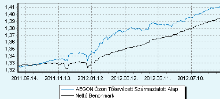
EGY JEGYRE JUTÓ NETTÓ ESZKÖZÉRTÉK, 2011.09.01 - 2012.08.31

Az alapok múltbeli teljesítménye nem nyújt garanciát a jövőbeli hozamok nagyságára. Jelen hirdetés nem minősül ajánlattételnek vagy befektetési tanácsadásnak. A befektetés részletes feltételeit az Alap Tájékoztatója tartalmazza, mely a mindenkor érvényes kondíciós listákkal együtt megtalálható a forgalmazási helyeken. A befektetési alap forgalmazásával (vétel, tartás, eladás) kapcsolatos költségek az alap kezelési szabályzatában és a forgalmazási helyeken megismerhetők.