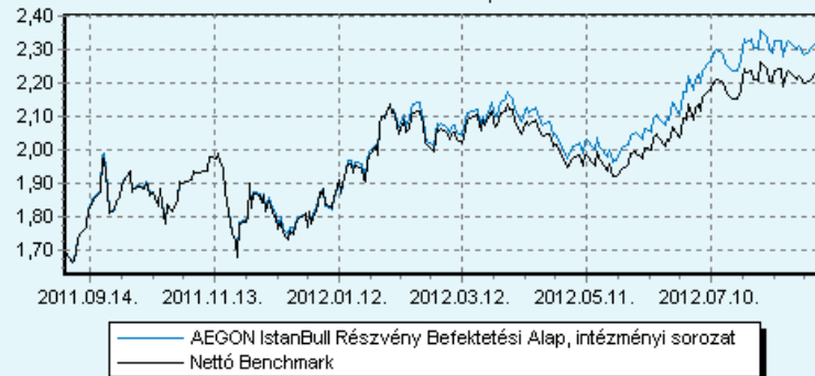
EGY JEGYRE JUTÓ NETTÓ ESZKÖZÉRTÉK, 2011.09.01 - 2012.08.31

Az alapok múltbeli teljesítménye nem nyújt garanciát a jövőbeli hozamok nagyságára. Jelen hirdetés nem minősül ajánlattételnek vagy befektetési tanácsadásnak. A befektetés részletes feltételeit az Alap Tájékoztatója tartalmazza, mely a mindenkor érvényes kondíciós listákkal együtt megtalálható a forgalmazási helyeken. A befektetési alap forgalmazásával (vétel, tartás, eladás) kapcsolatos költségek az alap kezelési szabályzatában és a forgalmazási helyeken megismerhetők.