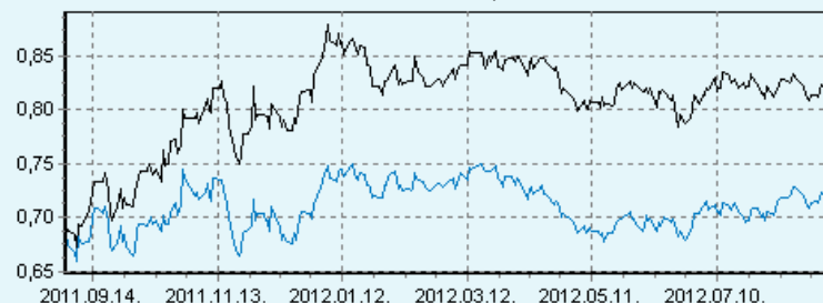
EGY JEGYRE JUTÓ NETTÓ ESZKÖZÉRTÉK, 2011.09.01 - 2012.08.31

Az alapok múltbeli teljesítménye nem nyújt garanciát a jövőbeli hozamok nagyságára. Jelen hirdetés nem minősül ajánlattételnek vagy befektetési tanácsadásnak. A befektetés részletes feltételeit az Alap Tájékoztatója tartalmazza, mely a mindenkor érvényes kondíciós listákkal együtt megtalálható a forgalmazási helyeken. A befektetési alap forgalmazásával (vétel, tartás, eladás) kapcsolatos költségek az alap kezelési szabályzatában és a forgalmazási helyeken megismerhetők.