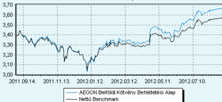
EGY JEGYRE JUTÓ NETTÓ ESZKÖZÉRTÉK, 2011.09.01 - 2012.08.31

Az alapok múltbeli teljesítménye nem nyújt garanciát a jövőbeli hozamok nagyságára. Jelen hirdetés nem minősül ajánlattételnek vagy befektetési tanácsadásnak. A befektetés részletes feltételeit az Alap Tájékoztatója tartalmazza, mely a mindenkor érvényes kondíciós listákkal együtt megtalálható a forgalmazási helyeken. A befektetési alap forgalmazásával (vétel, tartás, eladás) kapcsolatos költségek az alap kezelési szabályzatában és a forgalmazási helyeken megismerhetők.