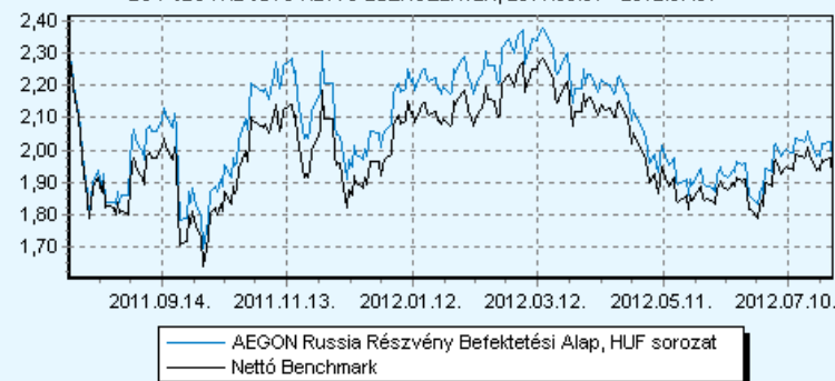
EGY JEGYRE JUTÓ NETTÓ ESZKÖZÉRTÉK, 2011.08.01 - 2012.07.31

Az alapok múltbeli teljesítménye nem nyújt garanciát a jövőbeli hozamok nagyságára. Jelen hirdetés nem minősül ajánlattételnek vagy befektetési tanácsadásnak. A befektetés részletes feltételeit az Alap Tájékoztatója tartalmazza, mely a mindenkor érvényes kondíciós listákkal együtt megtalálható a forgalmazási helyeken. A befektetési alap forgalmazásával (vétel, tartás, eladás) kapcsolatos költségek az alap kezelési szabályzatában és a forgalmazási helyeken megismerhetők.