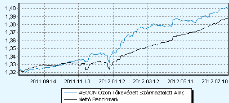
EGY JEGYRE JUTÓ NETTÓ ESZKÖZÉRTÉK, 2011.08.01 - 2012.07.31

Az alapok múltbeli teljesítménye nem nyújt garanciát a jövőbeli hozamok nagyságára. Jelen hirdetés nem minősül ajánlattételnek vagy befektetési tanácsadásnak. A befektetés részletes feltételeit az Alap Tájékoztatója tartalmazza, mely a mindenkor érvényes kondíciós listákkal együtt megtalálható a forgalmazási helyeken. A befektetési alap forgalmazásával (vétel, tartás, eladás) kapcsolatos költségek az alap kezelési szabályzatában és a forgalmazási helyeken megismerhetők.