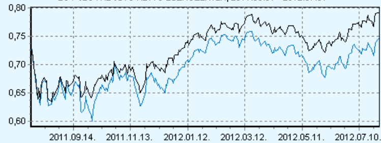
EGY JEGYRE JUTÓ NETTÓ ESZKÖZÉRTÉK, 2011.08.01 - 2012.07.31

Az alapok múltbeli teljesítménye nem nyújt garanciát a jövőbeli hozamok nagyságára. Jelen hirdetés nem minősül ajánlattételnek vagy befektetési tanácsadásnak. A befektetés részletes feltételeit az Alap Tájékoztatója tartalmazza, mely a mindenkor érvényes kondíciós listákkal együtt megtalálható a forgalmazási helyeken. A befektetési alap forgalmazásával (vétel, tartás, eladás) kapcsolatos költségek az alap kezelési szabályzatában és a forgalmazási helyeken megismerhetők.