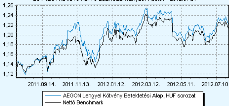
EGY JEGYRE JUTÓ NETTÓ ESZKÖZÉRTÉK, 2011.08.01 - 2012.07.31

Az alapok múltbeli teljesítménye nem nyújt garanciát a jövőbeli hozamok nagyságára. Jelen hirdetés nem minősül ajánlattételnek vagy befektetési tanácsadásnak. A befektetés részletes feltételeit az Alap Tájékoztatója tartalmazza, mely a mindenkor érvényes kondíciós listákkal együtt megtalálható a forgalmazási helyeken. A befektetési alap forgalmazásával (vétel, tartás, eladás) kapcsolatos költségek az alap kezelési szabályzatában és a forgalmazási helyeken megismerhetők.