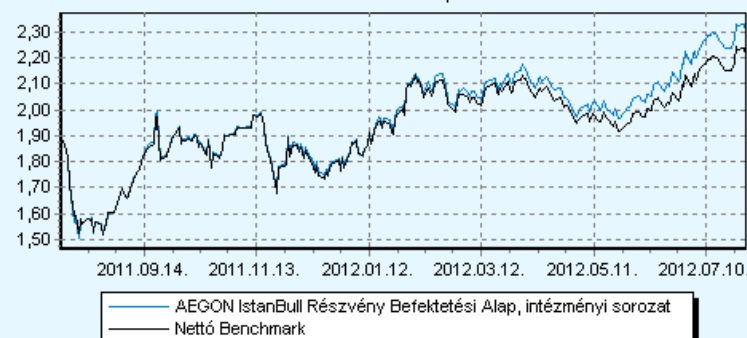
EGY JEGYRE JUTÓ NETTÓ ESZKÖZÉRTÉK, 2011.08.01 - 2012.07.31

Az alapok múltbeli teljesítménye nem nyújt garanciát a jövőbeli hozamok nagyságára. Jelen hirdetés nem minősül ajánlattételnek vagy befektetési tanácsadásnak. A befektetés részletes feltételeit az Alap Tájékoztatója tartalmazza, mely a mindenkor érvényes kondíciós listákkal együtt megtalálható a forgalmazási helyeken. A befektetési alap forgalmazásával (vétel, tartás, eladás) kapcsolatos költségek az alap kezelési szabályzatában és a forgalmazási helyeken megismerhetők.