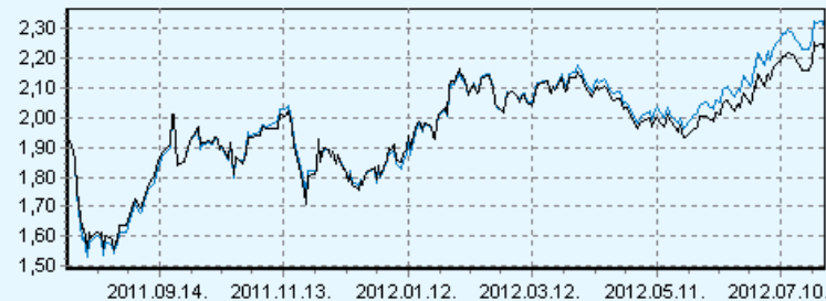
EGY JEGYRE JUTÓ NETTÓ ESZKÖZÉRTÉK, 2011.08.01 - 2012.07.31

— AEGON IstanBull Részvény Befektetési Alap, HUF sorozat — Nettó Benchmark