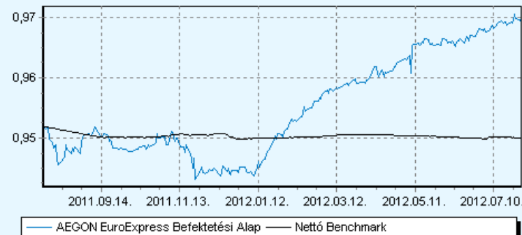
EGY JEGYRE JUTÓ NETTÓ ESZKÖZÉRTÉK, 2011.08.01 - 2012.07.31

Az alapok múltbeli teljesítménye nem nyújt garanciát a jövőbeli hozamok nagyságára. Jelen hirdetés nem minősül ajánlattételnek vagy befektetési tanácsadásnak. A befektetés részletes feltételeit az Alap Tájékoztatója tartalmazza, mely a mindenkor érvényes kondíciós listákkal együtt megtalálható a forgalmazási helyeken. A befektetési alap forgalmazásával (vétel, tartás, eladás) kapcsolatos költségek az alap kezelési szabályzatában és a forgalmazási helyeken megismerhetők.