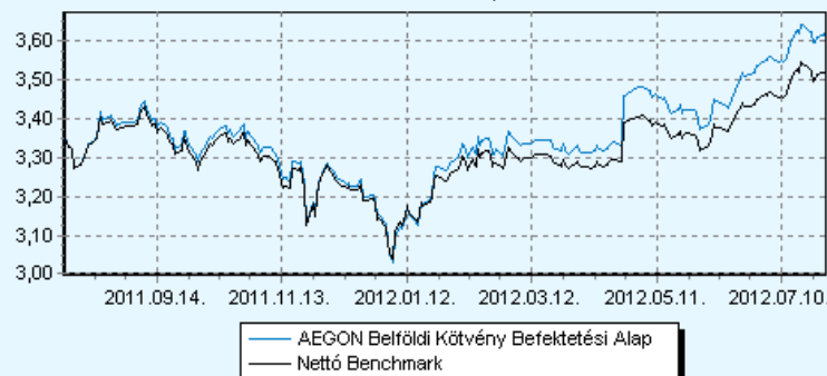
EGY JEGYRE JUTÓ NETTÓ ESZKÖZÉRTÉK, 2011.08.01 - 2012.07.31

Az alapok múltbeli teljesítménye nem nyújt garanciát a jövőbeli hozamok nagyságára. Jelen hirdetés nem minősül ajánlattételnek vagy befektetési tanácsadásnak. A befektetés részletes feltételeit az Alap Tájékoztatója tartalmazza, mely a mindenkor érvényes kondíciós listákkal együtt megtalálható a forgalmazási helyeken. A befektetési alap forgalmazásával (vétel, tartás, eladás) kapcsolatos költségek az alap kezelési szabályzatában és a forgalmazási helyeken megismerhetők.