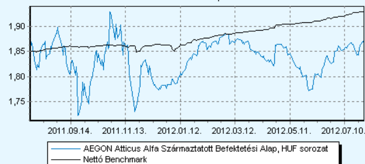
EGY JEGYRE JUTÓ NETTÓ ESZKÖZÉRTÉK, 2011.08.01 - 2012.07.31

Az alapok múltbeli teljesítménye nem nyújt garanciát a jövőbeli hozamok nagyságára. Jelen hirdetés nem minősül ajánlattételnek vagy befektetési tanácsadásnak. A befektetés részletes feltételeit az Alap Tájékoztatója tartalmazza, mely a mindenkor érvényes kondíciós listákkal együtt megtalálható a forgalmazási helyeken. A befektetési alap forgalmazásával (vétel, tartás, eladás) kapcsolatos költségek az alap kezelési szabályzatában és a forgalmazási helyeken megismerhetők.