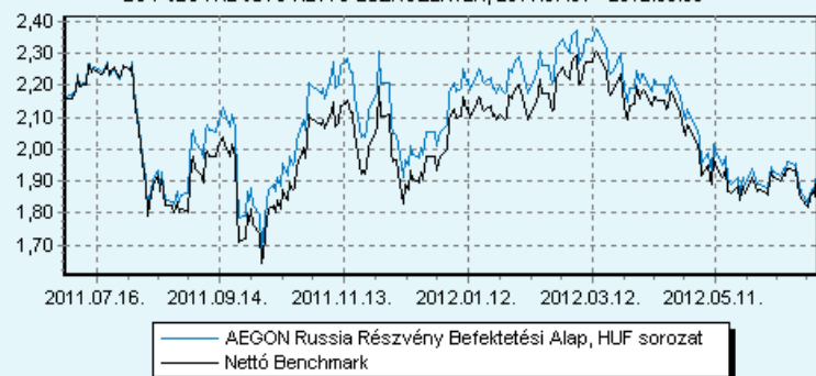
EGY JEGYRE JUTÓ NETTÓ ESZKÖZÉRTÉK, 2011.07.01 - 2012.06.30

Az alapok múltbeli teljesítménye nem nyújt garanciát a jövőbeli hozamok nagyságára. Jelen hirdetés nem minősül ajánlattételnek vagy befektetési tanácsadásnak. A befektetés részletes feltételeit az Alap Tájékoztatója tartalmazza, mely a mindenkor érvényes kondíciós listákkal együtt megtalálható a forgalmazási helyeken. A befektetési alap forgalmazásával (vétel, tartás, eladás) kapcsolatos költségek az alap kezelési szabályzatában és a forgalmazási helyeken megismerhetők.