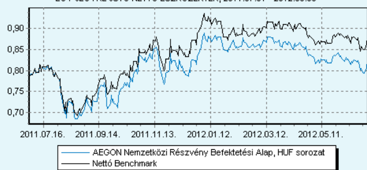
EGY JEGYRE JUTÓ NETTÓ ESZKÖZÉRTÉK, 2011.07.01 - 2012.06.30

Az alapok múltbeli teljesítménye nem nyújt garanciát a jövőbeli hozamok nagyságára. Jelen hirdetés nem minősül ajánlattételnek vagy befektetési tanácsadásnak. A befektetés részletes feltételeit az Alap Tájékoztatója tartalmazza, mely a mindenkor érvényes kondíciós listákkal együtt megtalálható a forgalmazási helyeken. A befektetési alap forgalmazásával (vétel, tartás, eladás) kapcsolatos költségek az alap kezelési szabályzatában és a forgalmazási helyeken megismerhetők.