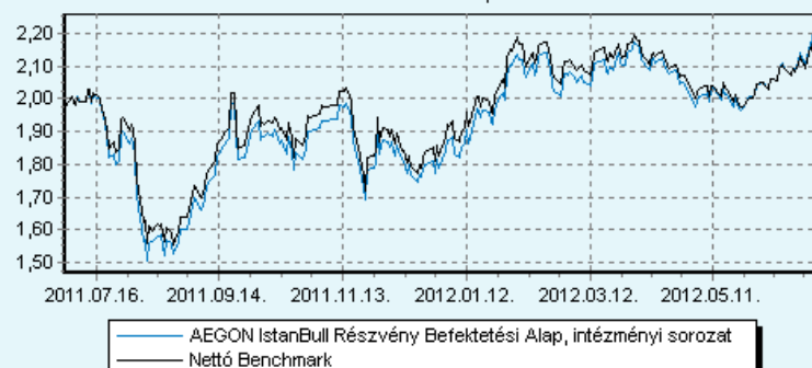
EGY JEGYRE JUTÓ NETTÓ ESZKÖZÉRTÉK, 2011.07.01 - 2012.06.30

Az alapok múltbeli teljesítménye nem nyújt garanciát a jövőbeli hozamok nagyságára. Jelen hirdetés nem minősül ajánlattételnek vagy befektetési tanácsadásnak. A befektetés részletes feltételeit az Alap Tájékoztatója tartalmazza, mely a mindenkor érvényes kondíciós listákkal együtt megtalálható a forgalmazási helyeken. A befektetési alap forgalmazásával (vétel, tartás, eladás) kapcsolatos költségek az alap kezelési szabályzatában és a forgalmazási helyeken megismerhetők.