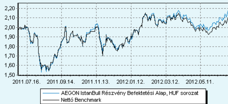
EGY JEGYRE JUTÓ NETTÓ ESZKÖZÉRTÉK, 2011.07.01 - 2012.06.30

Az alapok múltbeli teljesítménye nem nyújt garanciát a jövőbeli hozamok nagyságára. Jelen hirdetés nem minősül ajánlattételnek vagy befektetési tanácsadásnak. A befektetés részletes feltételeit az Alap Tájékoztatója tartalmazza, mely a mindenkor érvényes kondíciós listával együtt megtalálható a forgalmazási helyeken. A befektetési alap forgalmazásával (vétel, tartás, eladás) kapcsolatos költségek az alap kezelési szabályzatában és a forgalmazási helyeken megismerhetők.