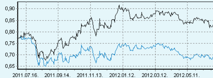
EGY JEGYRE JUTÓ NETTÓ ESZKÖZÉRTÉK, 2011.07.01 - 2012.06.30

Az alapok múltbeli teljesítménye nem nyújt garanciát a jövőbeli hozamok nagyságára. Jelen hirdetés nem minősül ajánlattételnek vagy befektetési tanácsadásnak. A befektetés részletes feltételeit az Alap Tájékoztatója tartalmazza, mely a mindenkor érvényes kondíciós listákkal együtt megtalálható a forgalmazási helyeken. A befektetési alap forgalmazásával (vétel, tartás, eladás) kapcsolatos költségek az alap kezelési szabályzatában és a forgalmazási helyeken megismerhetők.