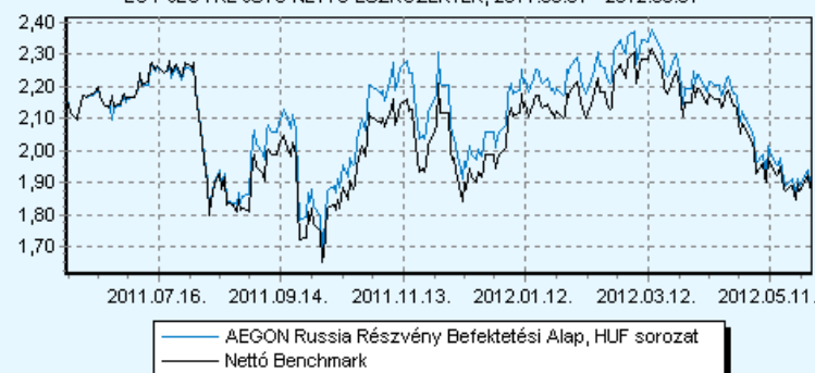
EGY JEGYRE JUTÓ NETTÓ ESZKÖZÉRTÉK, 2011.06.01 - 2012.05.31

Az alapok múltbeli teljesítménye nem nyújt garanciát a jövőbeli hozamok nagyságára. Jelen hirdetés nem minősül ajánlattételnek vagy befektetési tanácsadásnak. A befektetés részletes feltételeit az Alap Tájékoztatója tartalmazza, mely a mindenkor érvényes kondíciós listákkal együtt megtalálható a forgalmazási helyeken. A befektetési alap forgalmazásával (vétel, tartás, eladás) kapcsolatos költségek az alap kezelési szabályzatában és a forgalmazási helyeken megismerhetők.