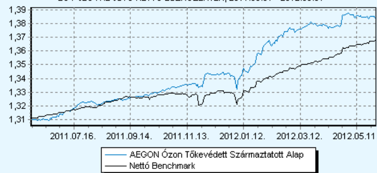
EGY JEGYRE JUTÓ NETTÓ ESZKÖZÉRTÉK, 2011.06.01 - 2012.05.31

Az alapok múltbeli teljesítménye nem nyújt garanciát a jövőbeli hozamok nagyságára. Jelen hirdetés nem minősül ajánlattételnek vagy befektetési tanácsadásnak. A befektetés részletes feltételeit az Alap Tájékoztatója tartalmazza, mely a mindenkor érvényes kondíciós listákkal együtt megtalálható a forgalmazási helyeken. A befektetési alap forgalmazásával (vétel, tartás, eladás) kapcsolatos költségek az alap kezelési szabályzatában és a forgalmazási helyeken megismerhetők.