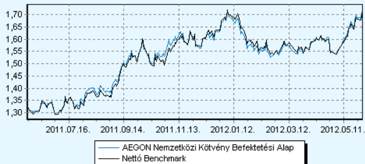
EGY JEGYRE JUTÓ NETTÓ ESZKÖZÉRTÉK, 2011.06.01 - 2012.05.31

Az alapok múltbeli teljesítménye nem nyújt garanciát a jövőbeli hozamok nagyságára. Jelen hirdetés nem minősül ajánlattételnek vagy befektetési tanácsadásnak. A befektetés részletes feltételeit az Alap Tájékoztatója tartalmazza, mely a mindenkor érvényes kondíciós listákkal együtt megtalálható a forgalmazási helyeken. A befektetési alap forgalmazásával (vétel, tartás, eladás) kapcsolatos költségek az alap kezelési szabályzatában és a forgalmazási helyeken megismerhetők.