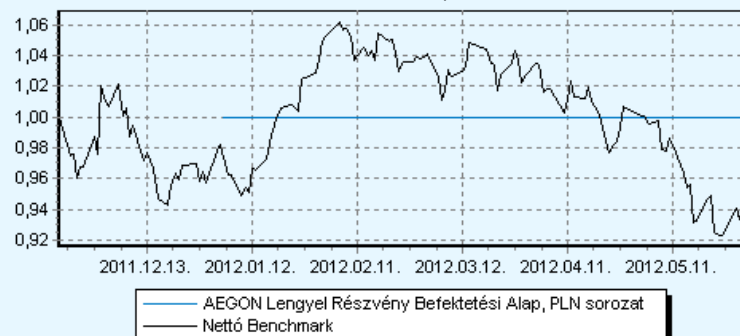
EGY JEGYRE JUTÓ NETTÓ ESZKÖZÉRTÉK, 2011.06.01 - 2012.05.31

Az alapok múltbeli teljesítménye nem nyújt garanciát a jövőbeli hozamok nagyságára. Jelen hirdetés nem minősül ajánlattételnek vagy befektetési tanácsadásnak. A befektetés részletes feltételeit az Alap Tájékoztatója tartalmazza, mely a mindenkor érvényes kondíciós listákkal együtt megtalálható a forgalmazási helyeken. A befektetési alap forgalmazásával (vétel, tartás, eladás) kapcsolatos költségek az alap kezelési szabályzatában és a forgalmazási helyeken megismerhetők.