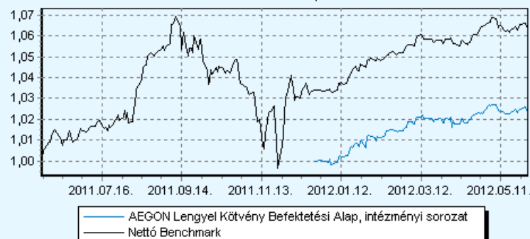
EGY JEGYRE JUTÓ NETTÓ ESZKÖZÉRTÉK, 2011.06.01 - 2012.05.31

Az alapok múltbeli teljesítménye nem nyújt garanciát a jövőbeli hozamok nagyságára. Jelen hirdetés nem minősül ajánlattételnek vagy befektetési tanácsadásnak. A befektetés részletes feltételeit az Alap Tájékoztatója tartalmazza, mely a mindenkor érvényes kondíciós listákkal együtt megtalálható a forgalmazási helyeken. A befektetési alap forgalmazásával (vétel, tartás, eladás) kapcsolatos költségek az alap kezelési szabályzatában és a forgalmazási helyeken megismerhetők.