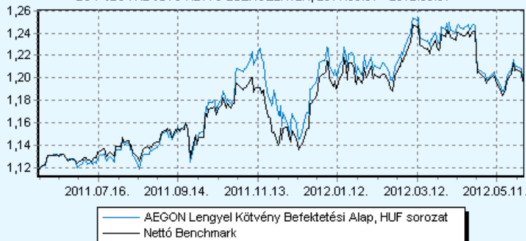
EGY JEGYRE JUTÓ NETTÓ ESZKÖZÉRTÉK, 2011.06.01 - 2012.05.31

Az alapok múltbeli teljesítménye nem nyújt garanciát a jövőbeli hozamok nagyságára. Jelen hirdetés nem minősül ajánlattételnek vagy befektetési tanácsadásnak. A befektetés részletes feltételeit az Alap Tájékoztatója tartalmazza, mely a mindenkor érvényes kondíciós listákkal együtt megtalálható a forgalmazási helyeken. A befektetési alap forgalmazásával (vétel, tartás, eladás) kapcsolatos költségek az alap kezelési szabályzatában és a forgalmazási helyeken megismerhetők.