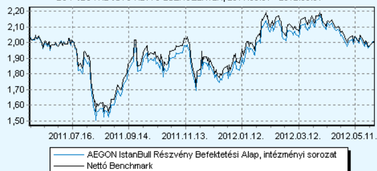
EGY JEGYRE JUTÓ NETTÓ ESZKÖZÉRTÉK, 2011.06.01 - 2012.05.31

Az alapok múltbeli teljesítménye nem nyújt garanciát a jövőbeli hozamok nagyságára. Jelen hirdetés nem minősül ajánlattételnek vagy befektetési tanácsadásnak. A befektetés részletes feltételeit az Alap Tájékoztatója tartalmazza, mely a mindenkor érvényes kondíciós listákkal együtt megtalálható a forgalmazási helyeken. A befektetési alap forgalmazásával (vétel, tartás, eladás) kapcsolatos költségek az alap kezelési szabályzatában és a forgalmazási helyeken megismerhetők.