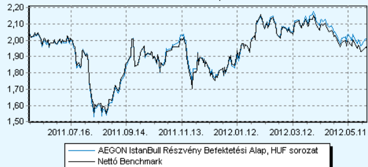
EGY JEGYRE JUTÓ NETTÓ ESZKÖZÉRTÉK, 2011.06.01 - 2012.05.31

Az alapok múltbeli teljesítménye nem nyújt garanciát a jövőbeli hozamok nagyságára. Jelen hirdetés nem minősül ajánlattételnek vagy befektetési tanácsadásnak. A befektetés részletes feltételeit az Alap Tájékoztatója tartalmazza, mely a mindenkor érvényes kondíciós listákkal együtt megtalálható a forgalmazási helyeken. A befektetési alap forgalmazásával (vétel, tartás, eladás) kapcsolatos költségek az alap kezelési szabályzatában és a forgalmazási helyeken megismerhetők.