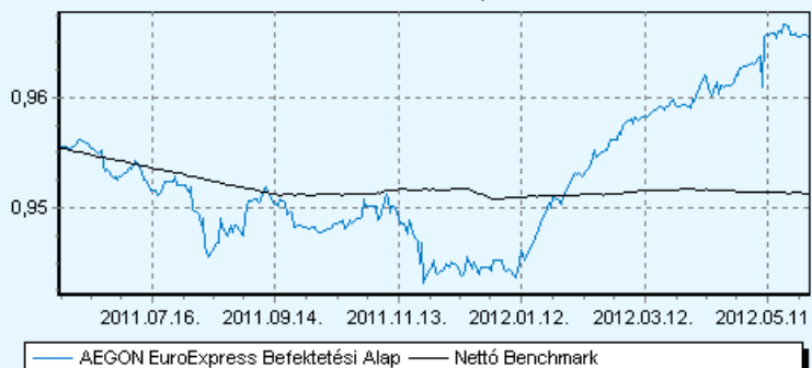
EGY JEGYRE JUTÓ NETTÓ ESZKÖZÉRTÉK, 2011.06.01 - 2012.05.31

Az alapok múltbeli teljesítménye nem nyújt garanciát a jövőbeli hozamok nagyságára. Jelen hirdetés nem minősül ajánlattételnek vagy befektetési tanácsadásnak. A befektetés részletes feltételeit az Alap Tájékoztatója tartalmazza, mely a mindenkor érvényes kondíciós listákkal együtt megtalálható a forgalmazási helyeken. A befektetési alap forgalmazásával (vétel, tartás, eladás) kapcsolatos költségek az alap kezelési szabályzatában és a forgalmazási helyeken megismerhetők.