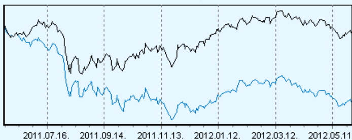
EGY JEGYRE JUTÓ NETTÓ ESZKÖZÉRTÉK, 2011.06.01 - 2012.05.31

— AEGON Climate Change Részvény Befektetési Alap, EUR sorozat — Nettó Benchmark