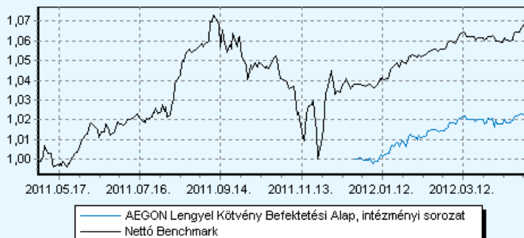
EGY JEGYRE JUTÓ NETTÓ ESZKÖZÉRTÉK, 2011.05.01 - 2012.04.30

Az alapok múltbeli teljesítménye nem nyújt garanciát a jövőbeli hozamok nagyságára. Jelen hirdetés nem minősül ajánlattételnek vagy befektetési tanácsadásnak. A befektetés részletes feltételeit az Alap Tájékoztatója tartalmazza, mely a mindenkor érvényes kondíciós listákkal együtt megtalálható a forgalmazási helyeken. A befektetési alap forgalmazásával (vétel, tartás, eladás) kapcsolatos költségek az alap kezelési szabályzatában és a forgalmazási helyeken megismerhetők.