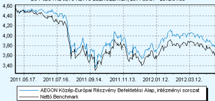
EGY JEGYRE JUTÓ NETTÓ ESZKÖZÉRTÉK, 2011.05.01 - 2012.04.30

Az alapok múltbeli teljesítménye nem nyújt garanciát a jövőbeli hozamok nagyságára. Jelen hirdetés nem minősül ajánlattételnek vagy befektetési tanácsadásnak. A befektetés részletes feltételeit az Alap Tájékoztatója tartalmazza, mely a mindenkor érvényes kondíciós listákkal együtt megtalálható a forgalmazási helyeken. A befektetési alap forgalmazásával (vétel, tartás, eladás) kapcsolatos költségek az alap kezelési szabályzatában és a forgalmazási helyeken megismerhetők.