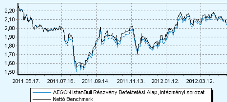
EGY JEGYRE JUTÓ NETTÓ ESZKÖZÉRTÉK, 2011.05.01 - 2012.04.30

Az alapok múltbeli teljesítménye nem nyújt garanciát a jövőbeli hozamok nagyságára. Jelen hirdetés nem minősül ajánlattételnek vagy befektetési tanácsadásnak. A befektetés részletes feltételeit az Alap Tájékoztatója tartalmazza, mely a mindenkor érvényes kondíciós listákkal együtt megtalálható a forgalmazási helyeken. A befektetési alap forgalmazásával (vétel, tartás, eladás) kapcsolatos költségek az alap kezelési szabályzatában és a forgalmazási helyeken megismerhetők.