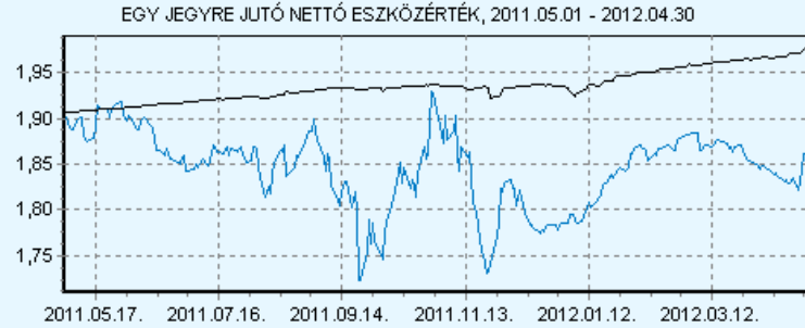
EGY JEGYRE JUTÓ NETTÓ ESZKÖZÉRTÉK, 2011.05.01 - 2012.04.30

Az alapok múltbeli teljesítménye nem nyújt garanciát a jövőbeli hozamok nagyságára. Jelen hirdetés nem minősül ajánlattételnek vagy befektetési tanácsadásnak. A befektetés részletes feltételeit az Alap Tájékoztatója tartalmazza, mely a mindenkor érvényes kondíciók listákkal együtt megtalálható a forgalmazási helyeken. A befektetési alap forgalmazásával (vétel, tartás, eladás) kapcsolatos költségek az alap kezelési szabályzatában és a forgalmazási helyeken megismerhetők.